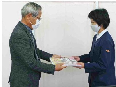
大浦地会長から児童代表へ

始業式の後、始良校区コミュニティから、道路手前で安全を確かめる目印「ストップマーク」の贈呈がありました。子どもたちの安全は地域の皆さんの願いでもあります。子どもたちの交通安全の意識が高まり実践ができるよう、ありがたく役立てたいと思います。