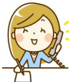
《電話・ファックス》