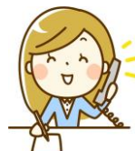
《電話・ファックス》