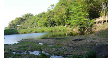
⑭栂山池 (布引滝近く)

布引滝下の 浅い池です。 人気のない 場所ですの で子どもだ けで行か ないよう に。