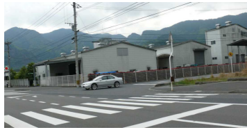
④トラックの出入りが多い交差点 (上水流地区)