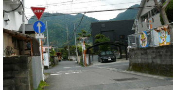
⑦見通しの悪い中道の交差点 (クオラ保育園前)