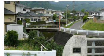
⑮橋が続く土手の高い川 (白金原地区など)

布引滝下の 浅い池です。 人気のない 場所ですの で子どもだ けで行か ないよう に。