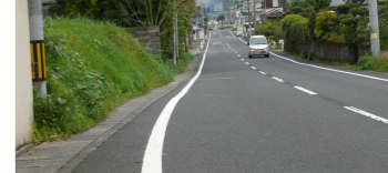
⑩歩道、ガードレールがなく交通量の多い道路 (奥山花地区)