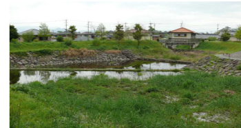
⑬思川水利 (白金公園下)