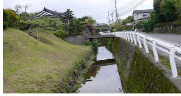
③用水路の続く所 (上水流地区など)