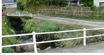
②ガードレールがない土手 (反田下)