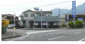
⑤信号機のない長い横断歩道 (消防分遣所前)