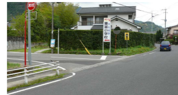
⑫見通しの悪い交差点 (星原地区)