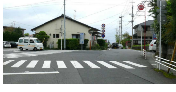
⑥見通しの悪い交差点 (松山豆腐店近く)