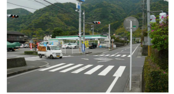
⑨ファミリーマート前交差点