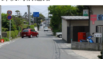
⑯重富郵便局前道路