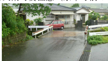
⑧大雨時要注意 (永平寺前の側溝沿い)