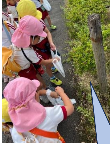
ひろったゴミは袋に入れて!