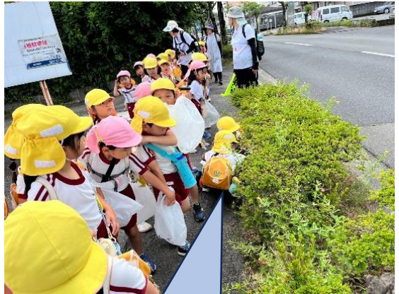
ここにゴミがあったよ!