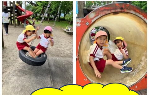
遊具で 沢山あそんだよ