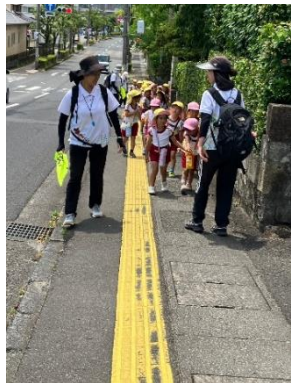
せんとり公園まで 加治木の街を歩き ながらゴミ拾いを しました。 落ちていたゴミが 少ないことにとて も驚きました。