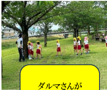
ダルマさんが 転んだ!