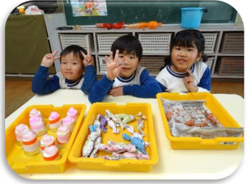
てんいんさんたちも いっぱいうりました◎

<協同性><思考力の芽生え><言葉による伝え合い><豊かな感性と表現> 3日間の縦割り保育を通して、子どもたちが自分で考えた作品を年長・年中・年少 合同で作ります。2日間制作した後、3日目は3つのグループに分かれて、買い 物の体験や店員さんの体験をします。 買い物を楽しんだ子どもたちは、買った物を家へ持ち帰り、きっと ご家庭でも会話が弾んだことでしょう。縦割りでの活動で、 年下への思いやり、年上の友だちへの憧れも芽生え、次の学年への意欲も湧きます。