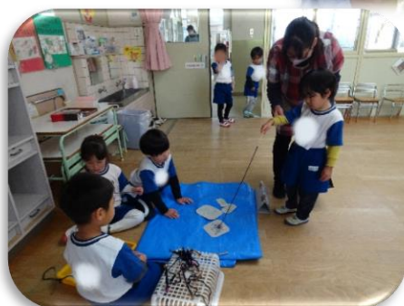
なにがつれるかな~♪