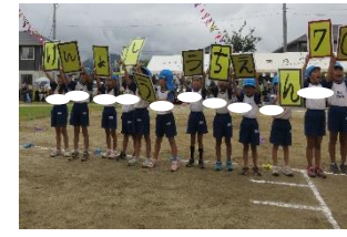
【幼稚園最後の運動会「きりん組・ダンデライオン(遊戯)」】

★令和6年度入園願書を、10/16(月)から配布しております。願書受付期間は、10/30(月)～11/17(金)です。また、園見学も受け付けておりますので、建昌幼稚園(☎65-2140)まで御連絡ください。今日も、子どもたちと先生方の元気な声が響く建昌幼稚園です。