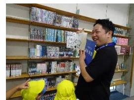
【アニメの本も貸出・書庫見学】