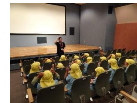
【視聴覚室見学・たんぼぼ会の打合せ】