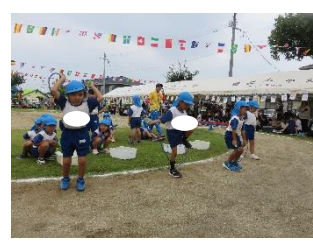
【10/3(日)第70回運動会「開会式」「こあら組・かけっこ」「きりんピック2023」】