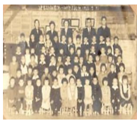
【建昌幼稚園第1回修了記念写真 1955. 3.20】