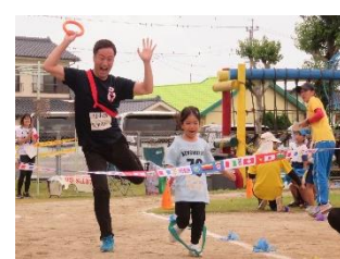
【「みんなでつなGO!親子リレー」世代をつないで、みんなにこにこ!】