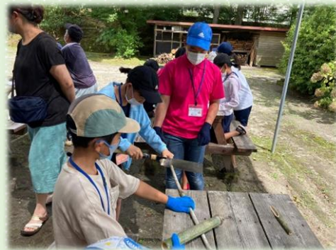
▲竹水鉄砲づくりの様子