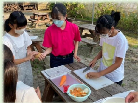
▲カレーづくりの様子