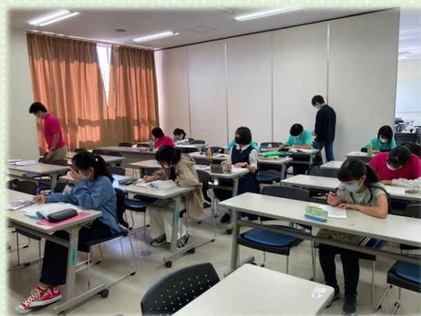
▲レベルアッププログラム 2022の様子