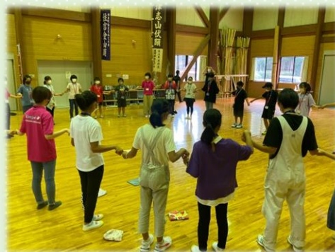
▲レクリエーションの様子