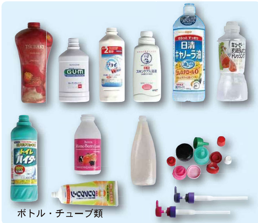
ボトル・チューブ類