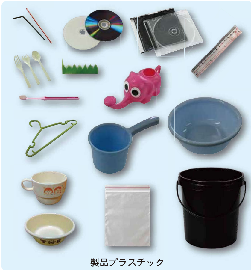
製品プラスチック

※1辺が50cm以上のものは切ることで「その他のプラスチック」として排出することができます。