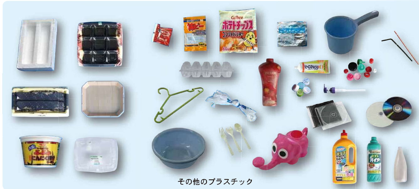
その他のプラスチック

カップやボトル本体だけでなく、キャップ・ふた、ビニール袋やラップ、トレーも対象となります。