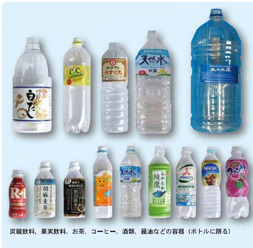
炭酸飲料、果実飲料、お茶、コーヒー、酒類、醤油などの容器（ボトルに限る）