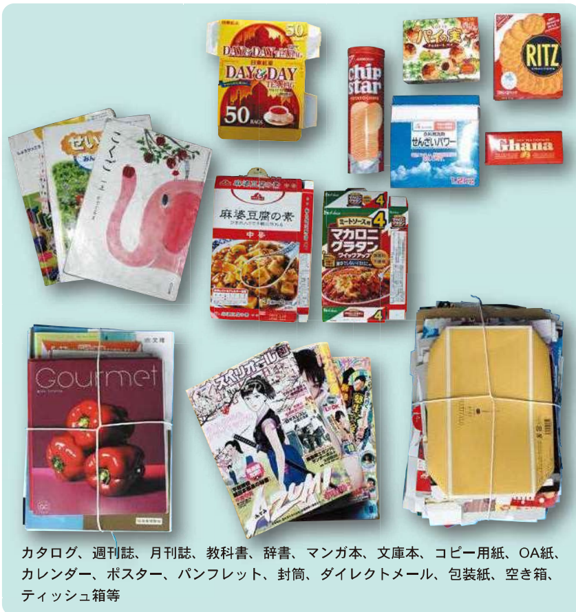
カタログ、週刊誌、月刊誌、教科書、辞書、マンガ本、文庫本、コピー用紙、OA紙、カレンダー、ポスター、パンフレット、封筒、ダイレクトメール、包装紙、空き箱、ティッシュ箱等

※官製はがき以上の大きさで、「新聞紙・チラシ」「紙バック」「ダンボール・クラフト紙」でないすべての紙類をひとくくりにして排出することができます。ただし、禁忌品(30ページ)が混ざらないように注意して排出してください。