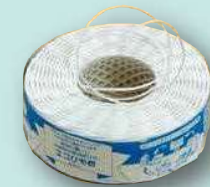
※この白い紙ひもは、市指定のごみ袋販売店で購入できます。

この白い紙ひもは、紙バックから再生されてできた紙ひもです。紙バックのバルブ繊維は長くて上質なので、リサイクルの際に他の紙類に混ぜても品質を低下させることはありません。