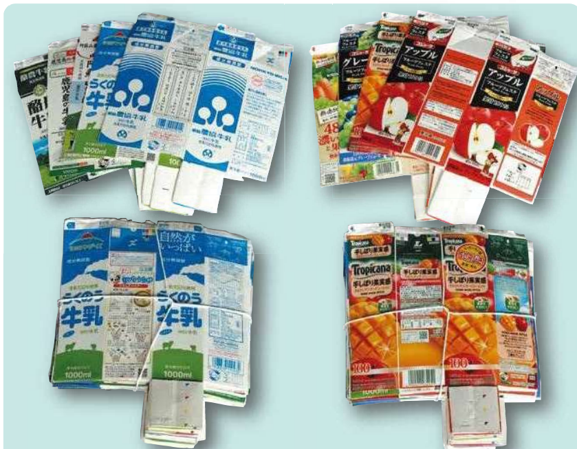
牛乳、ジュース、コーヒー、お茶の紙パック (500ml以上のもの)

ただし、プラスチック製のキャップや中栓は、「その他のプラスチック」として排出してください。