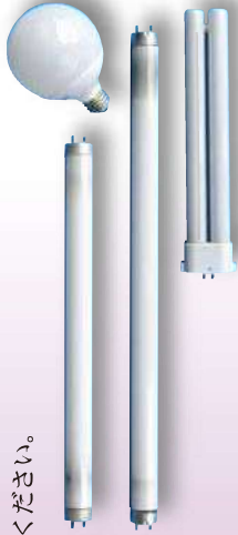
割れていない直管・円管

直管・円管の蛍光灯や蛍光灯管入りのボール球は、包装物を取り除いて、割れないように排出してください。