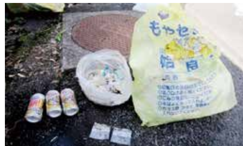
可燃ごみステーションに出されていた違反ごみ