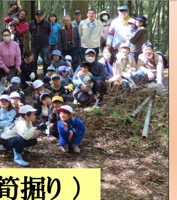
体験活動①(親子筍掘り)