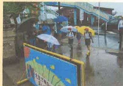
おやじ会のあいさつ運動

子どもたちは毎日安全に登下校していますか？ 先月の学校だよりでは“命を守ろう”とお願いしましたが、皆様の御協力で事故等の連絡もなく無事過ごせているようです。