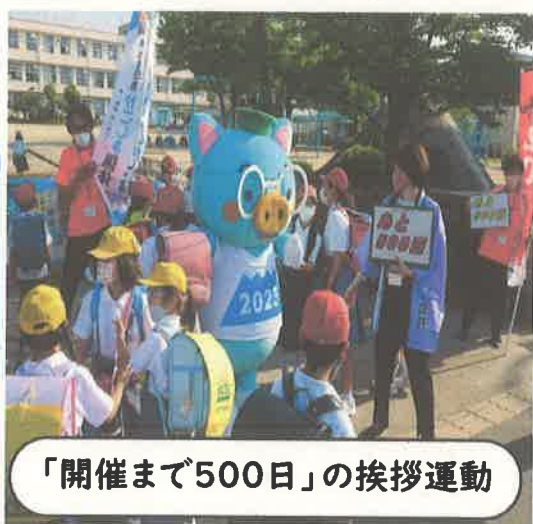
「開催まで500日」の挨拶運動