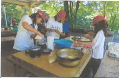
カレー作り，大成功！