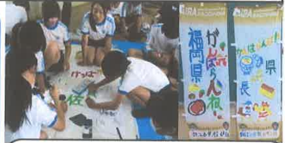
さすが6年生，ばっちりです。ありがとうございます！

「燃ゆる感動かごしま国体」開催に向けて、6年生が「応援のぼり旗」を作成しました。他県（高知・福岡・長崎・佐賀）応援用の旗ですが、4県の特徴を調べ、調べたことをもとに心を込めて作成しました。これを機会に更に“地元開催”のかごしま国体を身近に感じて、更に盛り上げていきたいですね。キバレ！始良市！キバレ鹿児島県！！