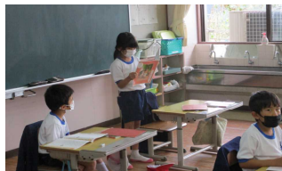
【心の教育道徳授業】

学習発表会では、音読劇や総合的な学習の時間の発表、社会科や体育の発表、ダンス、合唱・合奏など各学級工夫を凝らした発表をすることができました。子供たちの頑張りに、会場は大いに盛り上がりました。