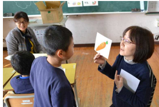
【栄養士の先生の講話】

児童が書いたお礼の手紙には、「学習した事を今後の生活に活かしていきたいです。」と、表現されていました。