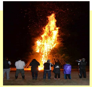
【鬼火焚き風景より】