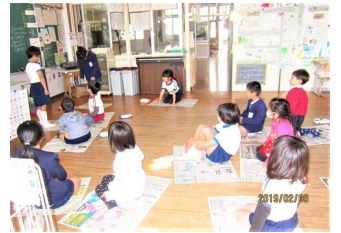
【ふれあう子どもたち】