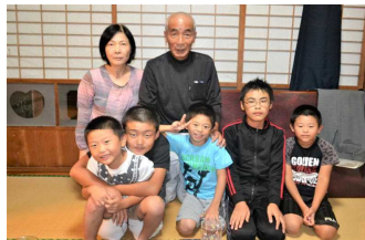
【「もらい湯さん」宅で】