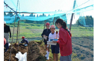
【感想を発表しました】