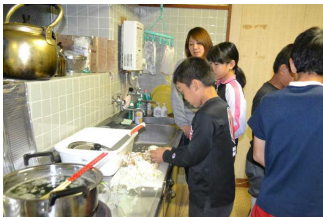
【初めてのみそ汁作り】

この貴重な経験を、今後の家庭生活や学校生活に生かし、家族や集団の一員として進んで手伝いやボランティア活動に取り組むなど、身に付けた事を是非実践してほしいと思います。