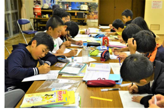
【公民館での学習時間】