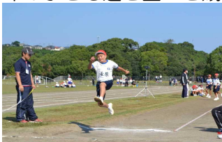
【勢いよくジャンプ！】

5・6年生13人が市陸上記録会に参加しました。前日までの練習の成果を発揮することができた子、緊張から思うような結果が出なかった子と様々だったようです。しかし、他校の同学年の子ども達と堂々と競い合っていました。