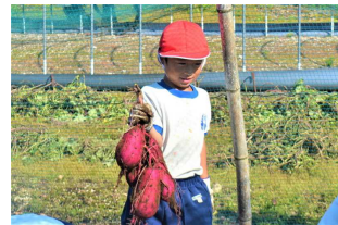
【大きなお芋でしょ】

5月末に植えた苗から、大きなサツマイモがたくさん収穫できました。シルバー人材センターの方々には、大変お世話になりました。お陰様でとても貴重な体験ができました。有り難うございました。当日は始良ビューFMの取材もあり、感想を発表していました。