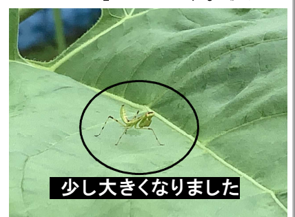
少し大きくなりました