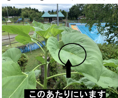
このあたりにいます

【その2】 左下の写真のヒマワリの葉っぱの上の○印の所に、カマキリの「コドモ」がいます。拡大したのが右下の写真です。先月号で紹介した5月18日にタマゴからぞろぞろ出てきたカマキリの中の1匹かもしれません。3cmぐらいまで成長し、少したくましさを感じられるようになりました。観察していると葉っぱの上でゆれながら、近づいてきたハエをカマで獲まえようとしたのですが…惜しくも失敗。逃げられてしまいました。