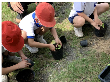
【わた毛の種をまいたたんぽぽが大きくなりました】

小学校の学習では、五感といわれる視覚・聴覚・嗅覚・味覚・触覚の感覚をしっかりと育み、真に力をつける学習方法を身につけさせていきたいと思えます。