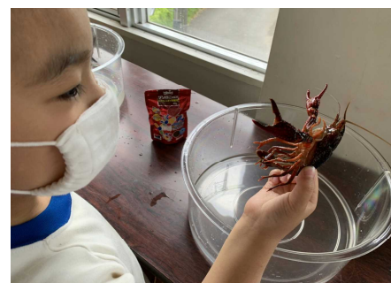
【すごいでしょ ザリガニつかめたよ】