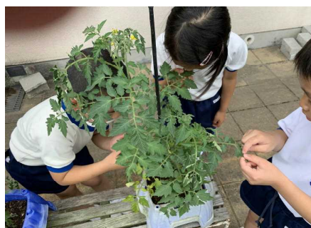
【大発見！トマトは、葉っぱもトマトのにおいがする】