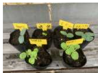
【理科の学習で臨時休業前に蒔いた種子が芽を出しました】

学校が再開となり、子供たちが、学校で生活をする「日常」が戻ってきたことを嬉しく思います。この「日常」を守るため、保護者並びに地域の皆様の御理解、御協力をお願い申し上げます。