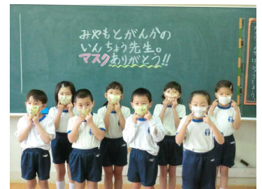
いただいた手作りマスク

連休が明け、ようやく一応の再スタートを切ることができました。なかなか学習活動を軌道に乗せることのできない状況でしたが、これから感染防止に努めつつ、子供たちと一生懸命