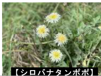
【シロバナタンポポ】