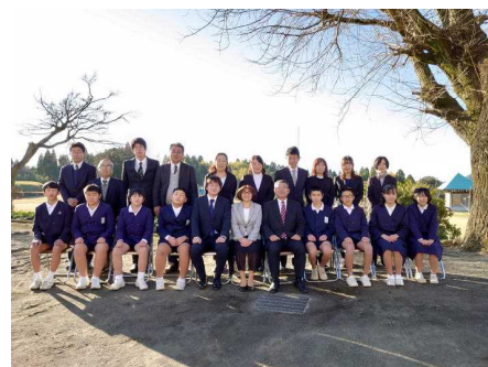
【凛々しい表情に成長した6年生】