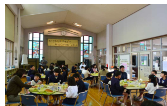
【交流給食での指導】