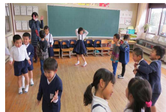
【ふれあう子どもたち】

○ 永原小学校では特認生も一緒に学習しています。興味のある方は本校までお問い合わせください。