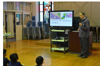
【全校朝会での講話】