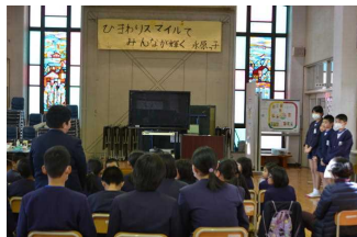
【人権についての話し合い】

また、「人権作文発表会」では、作文の発表だけでなく、人権についてのそれぞれの思いや考え、普段の自分の様子にも目を向けることができました。