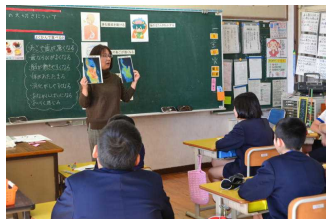
【栄養士の先生の講話】

また、いっしょに給食を食べながら、実践的な指導もしていただきました。子どもたちのこれからの生活につながる、とても有意義な時間となりました。