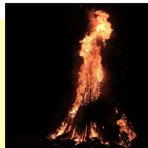
【鬼火焚き風景より】