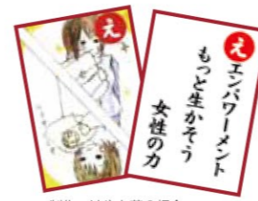
制作：はやと草の根会 協力：隼人工業高等学校美術部