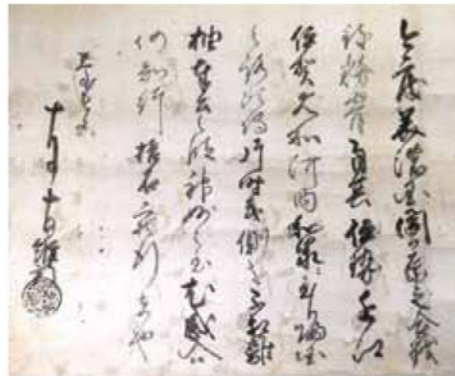
●関ヶ原合戦十石感状

書き出しに「今度美濃国関ヶ原之合戦」とあり、2行目以下に「伊勢・近江・伊賀・大和・河内・和泉」と鳥津軍の帰国の道筋が書かれています。この感状は慶長5年(1600年)10月に出されたものです。