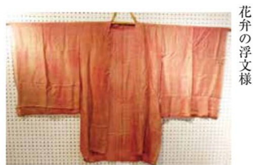
●紗の法衣 花卉の浮文様