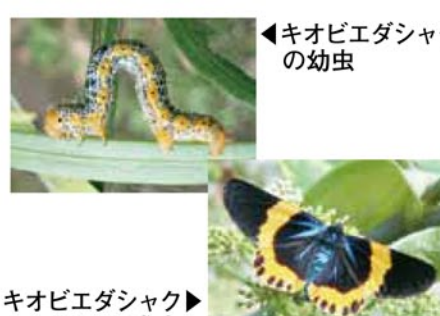
キオビエダシヤクの幼虫 (左) と成虫 (右)

布による駆除が効果的です。 ④薬剤を散布する際には、樹木の葉を食害する幼虫を確認し、直接幼虫に散布してください。幼虫は葉の裏にもいるため、薬剤が葉の裏にもかかるようにしましょう。 ⑤散布するときはマスク、手袋等を着用し、付近の人や車、農作物等に飛散しないようご注意ください。 ⑥薬剤は、エトフェロンプロック乳剤等(トレボン乳剤等)が効果的です。農協やホームセンター等で購入できます。森林組合でも取り扱っています。 ◎問合先Ⅱ 林務水産係 Tel 52-1211(内線232)