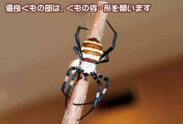
優良くもの部は、くもの姿・形を競います

くも合戦は、全国でもとても珍しい伝統行事です。毎年多くのかたが参加し、白熱する戦いに会場は盛り上がります。