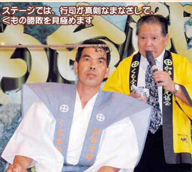
ステージでは、行司が真剣なまなざしで、くもの勝敗を見極めます

合戦の部で3連勝したくもだけが出場でき、トーナメント形式でチャンピオンくもを決定します。