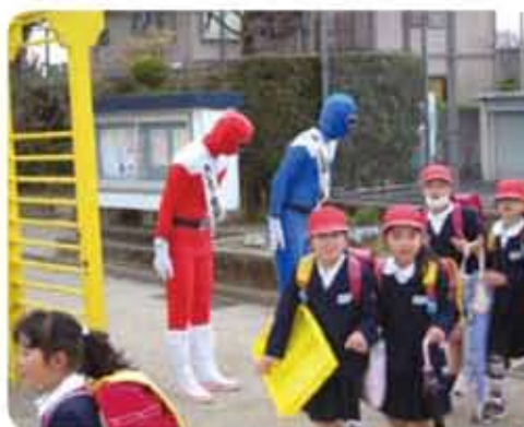
帖佐レンジャーによる正門での立哨指導

PTAでは、年間を通じて正門で朝のあいさつ運動を行っています。また、地域では、通学路で見守り隊のかたがたが登下校の見守りをおねがいをしています。