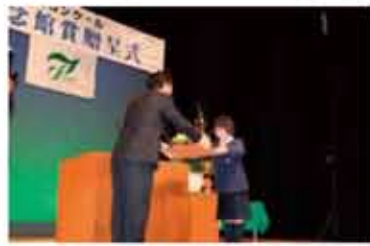
第21回椋鳩十文学記念館賞贈呈式