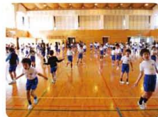
縄跳び大会の様子

帖佐小は、たくましい帖佐っ子の育成のため、一校一運動で「縄跳び運動」に取り組み、全身持久力や俊敏性、筋力の強化を進めています。