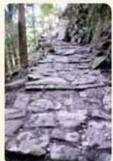
掛橋坂(かけはしのさか)

中世の頃は道幅が狭く危険な板敷きの道である(かけはし)であったと考えられ、地名の由来となったようです。江戸時代には、蘭牟田・祁答院方面と蒲生を結ぶ地方街道として利用され、道中最も厳しい難所として知られ、18世紀末までには、写真のような石段や切り石を敷き詰めた石畳が完成したようです。教育委員会では、現地調査を進め、文化的価値を見定めていきたいと考えています。現地での見学は可能ですが、危険箇所もありますので、安全には十分注意してください。