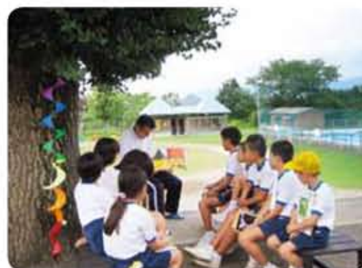
緑陰読書（銀杏の木の下で）

永原小では、児童の豊かな心を育むために、年間を通して、担任以外の職員による読み聞かせや読書郵便など、さまざまな特色ある読書活動に取り組んでいます。特に、小規模校の特性を生かした、全学年を縦割り班に分けて行う緑陰読書は、豊かな人間関係を築く上でも大きな効果を上げています。