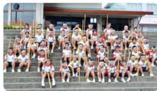
永原小の子どもたち全員集合!!