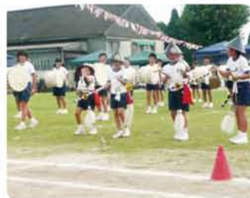
隔年で披露する運動会での「辺川棒踊り」と「吉左右踊り・太鼓踊り」

永原小では、地域の伝統芸能の継承活動に力を入れています。運動会において、「辺川棒踊り」と「吉左右踊り・太鼓踊り」を隔年で実施しています。どちらの踊りも