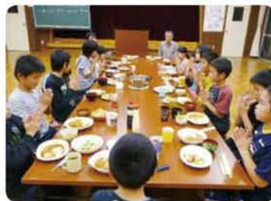
ふるさと学寮（食事の様子）

古くからそれぞれの地域に引き継がれてきた踊りであり、運動会前の練習には、それぞれの地域のかたがたがボランティアで指導されます。特に、「吉左右踊り・太鼓踊り」は、県の無形文化財に指定されている、大変貴重な踊りです。毎年行われる太鼓踊りの奉納の際に、永原小からも児童が参加し、その継承に積極的に協力しています。