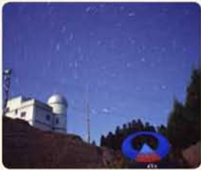
表紙の写真 スターランドAIRA

◆休館日 毎週月・火曜日(祝日の場合は開館)、毎月25日(土・日曜日)の場合は開館、年末年始(12月28日~1月4日) ◆開館時間 午前9時~午後4時30分(土・日曜日は午後1時~9時) ◆観測もできます。 また、口径40cmのカセグロニ式反射望遠鏡による天体の観測もできます。 折々のオリジナルプログラムを上映しています。 また、口径40cmのカセグロニ式反射望遠鏡による天体の観測もできます。