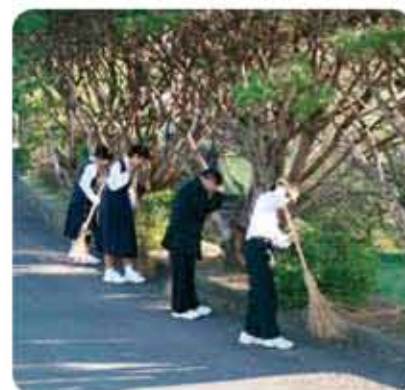
朝のボランティア活動

生徒会活動は活発で、執行部と各専門部長を中心に自主的・積極的に活動しています。毎朝7時45分から20分間、正門でのあいさつ運動、玄関付近の清掃、学級花壇の除草、室内の掃除等全生徒が分担しながらボランティア活動に取り組んでいます。また、毎週水曜日はベットボトル