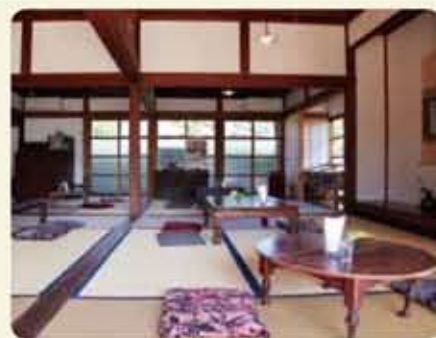
表紙の写真 あいらすウィッツ CAFEら・びゅー

蒲生町上久徳の武家屋敷通りにある築120年の古民家を蒲生観光交流センター別館として改装し、新しくオープンしたカフェです。 観光やまち歩き休憩スポットとしてはもちろんランチも楽しめます。 ◆営業時間 午前11時～午後5時 ◆問合先 蒲生観光交流センター Tel 5210748