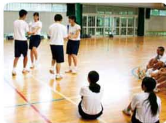
リーダー研修会(フォークダンスのリーダー養成中)

体育祭では全体練習の企画運営、練習中の留意事項の呼びかけ等も生徒会役員を中心に役割分担をして、生徒自身で作りに上げる体育祭となっています。文化祭でも生徒会役員が中心となり全体的なことは進めていきますが、各学年でも役割分担が