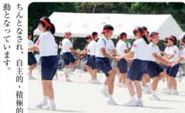
自主的に練習したフォークダンスの披露

ちんとなされ、自主的・積極的な活動となっています。また、集団宿泊学習・修学旅行等でも各学級の代議員や専門部正副部長が学級・学年のリーダーとなり係活動や班活動に積極的に取り組んでいます。