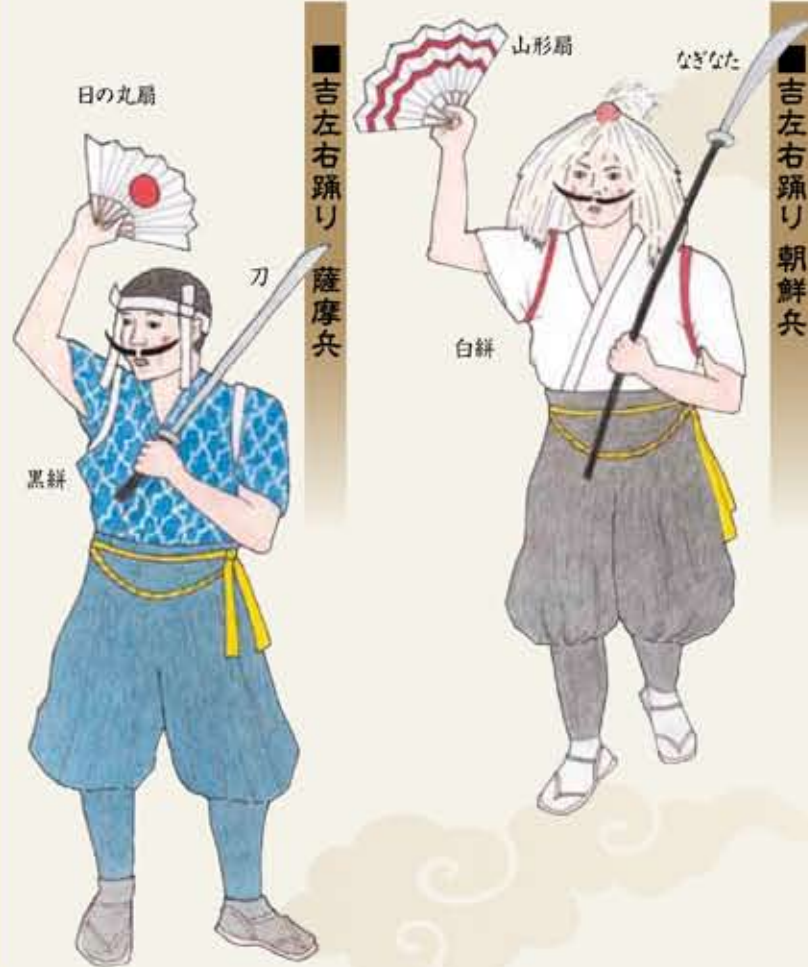
吉左右踊り 朝鮮兵

将来は、宿泊施設などで接客業をしてみたいです。地域の伝統を守り続けるためにも、できるだけ県内に就職して、太鼓踊りに関わり続けたいと考えています。