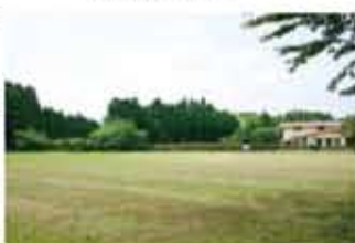
隣接するグラウンド

家庭にあるような便利な道具は、何もありませんが、今まで気付かなかったことを気付かせてくれる、そんな場所になるかもしれません。