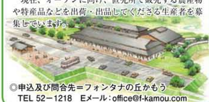
◎申込及び問合先=フォントナの丘かも TEL 52-1218 Eメール: office@f-kamou.com

商工観光課 10月末、蒲生町久末にオープン予定の産直交流施設「健康の駅「フォントナの丘かも」は、健康と癒しをテーマに、朝採れの新鮮な野菜や漁港直送の魚介類、こだわりの県内の特産品を販売する直売所を中心とした総合複合施設で、露天風呂付きの温泉施設や全室かけ流し露天風呂付きの宿泊施設で身体と心を癒したり、ハーフバイキングの自然食レストランで食事を楽しむこともできます。 現在、オープンに向け、直売所で販売する農産物や特産品などを出荷・出品して下さる生産者を募集しています。