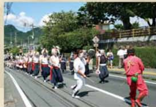
西別府吉左右踊り

吉左右踊りに登場する白装束・赤装束の「ドラ打ち」は、白・赤の狐で、鳥津の守り神「お稲荷様」と伝えられています。この2匹の狐が、朝鮮半島で道に迷った薩摩軍の道案内をしたと言われ、ユーモラスな動きが観衆の笑いを誘います。 民俗芸能が豊富な鹿児島県の中でも、始良市の太鼓踊りは夏を代表する風物詩のひとつです。