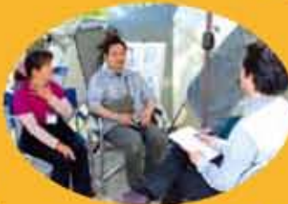
行けができた人気のお話コーナー