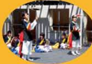
「カムルプ」展覧会」の中、中学生による読書体験活動の様子