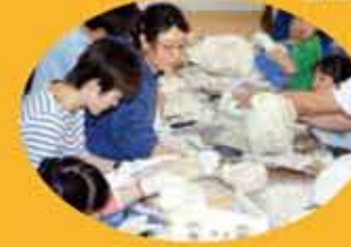
多くの子どもが参加した彫刻体験教室