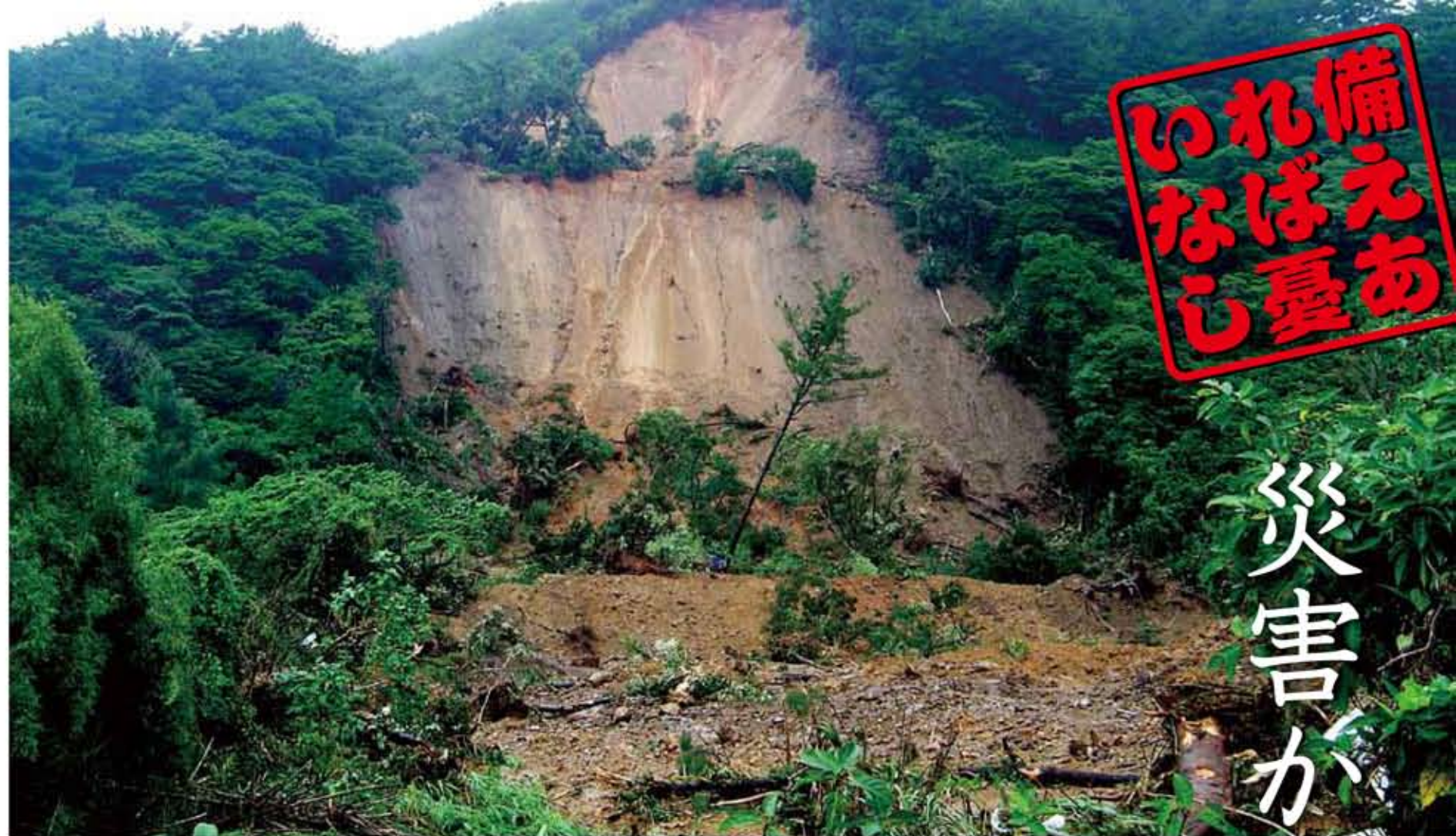
平成22年10月 豪雨災害 による被害 (龍郷町)

3月11日に東北地方・宮城県沖で発生した「東北方太平洋沖地震」は大規模な津波を伴い未曾有の大災害となりました。すでに3か月が経過しましたが、壊滅状態となった被災地域では、復旧作業が難航し、いまだに10万人を超えるかたがたが避難所生活を余儀なくされています。 市では、被災地への職員派遣や支援物資・義援金などの取り組みをはじめ、被災者の受け入れ態勢の整備など、今でできる支援策を進めています。この「東日本大震災」を対岸の火事として済ませず、地域全体の安全を自然災害から守ることを自らあらためて考えなければなりません。