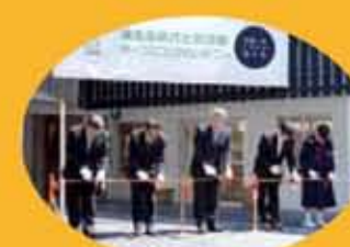
来賓によるテープカットで蒲生ふるさと交流館の幕開け