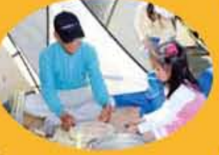
竹でつくった竹と人形を作った、昔ながらの遊びを体験