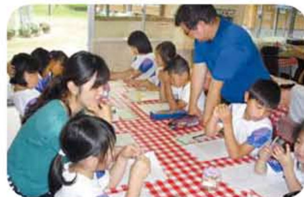
全校で俳句づくり