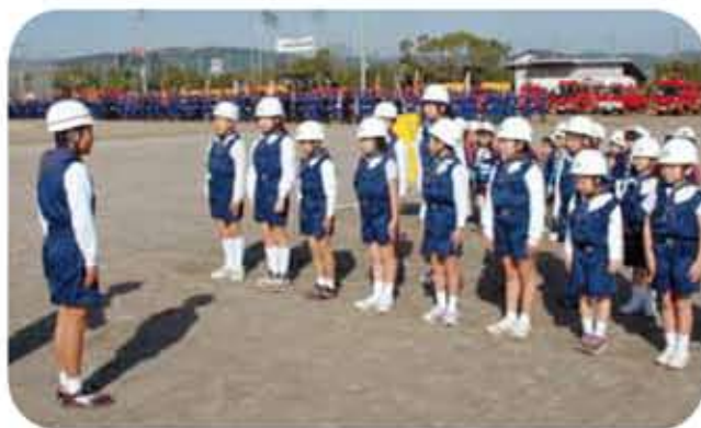
始良市出初式での規律訓練発表

少年消防クラブは今年で13年目になる活動です。火災予防、規律、礼儀、郷土愛、奉仕の精神を学びます。運動会や出初式で訓練の成果を発表しますので、ぜひご覧ください。これからも校区と共に、歴史と伝統を尊重しながら創造的に継承し、「地域に信頼される学校」を目指したいと思えます。