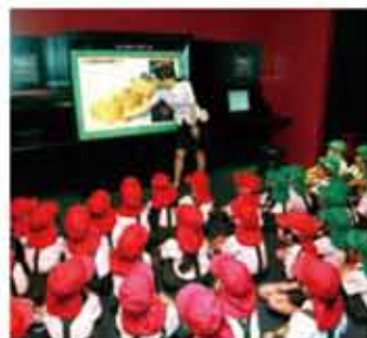
◎幼稚園児らが災害について学ぶ様子