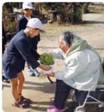
高齢者への花の宅配

春から初夏にかけて、県道42号線沿いは、市の花に指定された白やピンクのツツジが満開になります。正門を上っていくと、校舎前には色とりどりの花が咲いた鉢が置かれ、花いっぱい学校です。また校区の高齢者への花の宅配もしています。宅配の時、歌を歌ったり肩をもんだりして高齢者とふれあひもします。このような活動を通して、児童は命の尊さや思いやりを育んでいます。