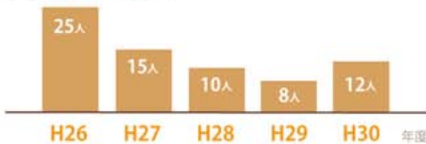
市の自殺者数推移

国の自殺死亡率(人口10万人あたりの死亡率)は、主要先進7か国の中で最も高い状態が続いています。市では平成26年をピークに減少していましたが、平成30年は増加しました。