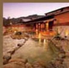
温泉 フォンタナの丘かもろ