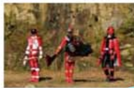
スーパー戦隊 MOVIE パーティー