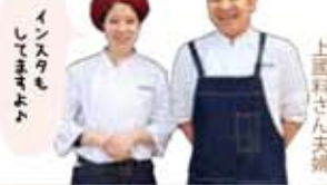
インスタも してまよよ

①人気NO.1のプリュレスフレは注文を受けてから1つずつキャラメリゼ(表面の砂糖をバーナーで炙る)する。②焼菓子の種類も豊富で、手土産にもぴったり。