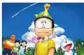
ドラえもん のび太の新恐竜