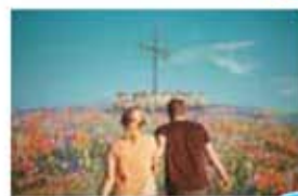
貴族降臨 PRINCE OF LEGEND