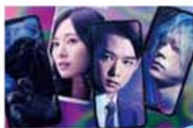
スマホを落としただけなのに 囚われの殺人鬼