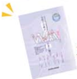
今年度作成した 市女性活躍推進特集

今回、その取り組みの一環で新たに特集冊子を作りました。女性活躍推進はなぜ必要か、女性活躍推進法とは何か、実際にどのような取り組みをしているのかという情報のほか、国や県の支援する補助金や制度情報を掲載。男女どちらも働きやすい職場環境にするために重要となる制度の最新情報も盛り込まれています。今後、商工会会員や市内各事業所にお届けするほか、市ホームページでも公開して広く市民のみなさんにご覧いただきたいと考えています。