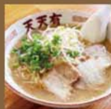
ラーメン 天天有 / 加治木