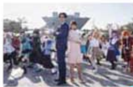
タクシに恋は難しい