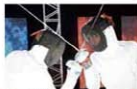
貴族降臨 PRINCE OF LEGEND