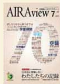
平成27年7月15日発行 第128号広報あいら Airview

加治木空襲など、ごく身近な故郷も戦地となったことを市民の戦争体験を交えて紹介。(県広報コンクール入選)