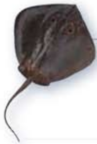
アカエイ Acuonotus abajoi

水深10m前後の岩・砂底にすむ。全長約2m。夏は美味で、フランス料理にも使われている。腹面(裏側)の縁がオレンジ色。