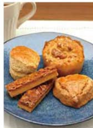
26 菓子工房 はな 「ままこうぼ」