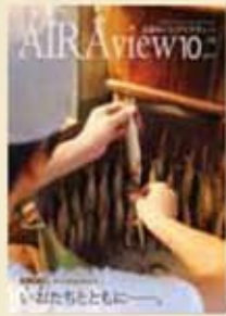
平成29年10月16日発行 第176号市報あいら Airview

10月は「いお＝鹿児島弁で“魚”」の月で、市の魚にまつわるエピソードを特集。(全国広報コンクール入選、県広報コンクール特選)