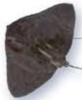
ツバクロエイ Gymnura japonica

水深10m前後の岩・砂底にすむ。全長約2m。夏は美味で、フランス料理にも使われている。腹面(裏側)の縁がオレンジ色。