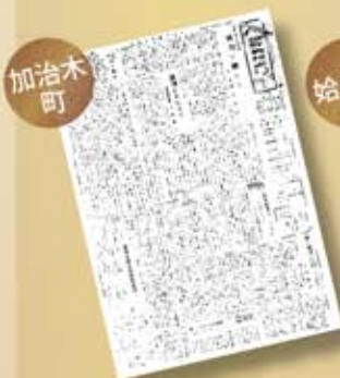
加治木町政だより 創刊号(昭和25年)

始良市デジタルミュージアムでは、旧町時代に発行された昭和20年代の広報紙なども閲覧できます。市の概要や歴史、文化財などもデータベース化され、今後も様々な情報を更新していく予定です。