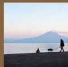
きれいな景色の重富海岸