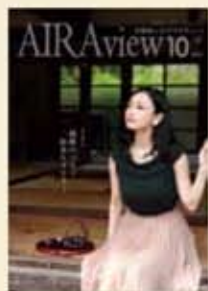
平成28年10月17日発行 第158号市報あいら Airview

焼酎をテーマに市内の焼酎に関する歴史や西郷隆盛の動向、酒器などを紹介。県・全国広報コンクールで入選しました。