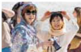
最高の人生の見つけ方 10/11金