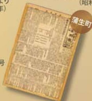
蒲生町報第20号 (昭和27年)