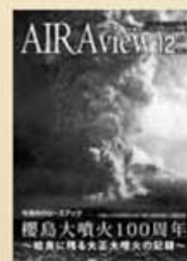
平成25年12月16日発行 第90号市報あいら Airview

大正時代に大噴火した桜島の脅威と人々の動きを伝える一冊。県広報コンクール広報紙部門で初入選を果たしました。