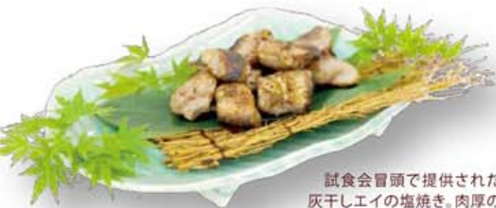
試食会冒頭で提供された 灰干しアエの塩焼き。肉厚の 白身魚といった食感。