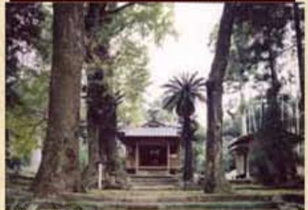
帖佐八幡神社 古い佇まいが残る。新正八幡宮とも呼ばれる。