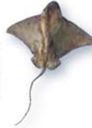
ナルトビエイ Aetideus narutoensis

南日本から南シナ海にかけて生息。砂泥底に住み小動物を食べる。全長約1m。胸びれが広くUFOのような形が特徴。