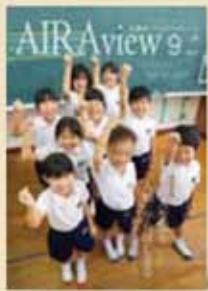
平成30年9月18日発行 第187号市報あいら Airview

市の「認知症の今」に着目し、認知症に接する人々の輪を取り上げました。(全国広報コンクール総務大臣賞、県広報コンクール特選)