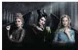
マレフィセント2 10/18金

左下の割引券を劇場窓口にお持ちください。1枚4名様まで有効です。保険証など市民を証明するものもあわせてご持参ください。