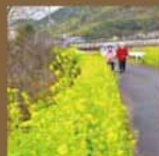
日木山川沿いの菜の花