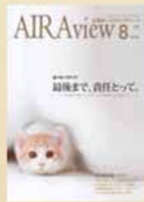
平成26年8月15日発行 第106号広報あいら Airview

見捨てられる動物たちを減らしたいと訴える企画。動物愛護やモラル向上の必要性、相談窓口などを紹介。(県広報コンクール入選)