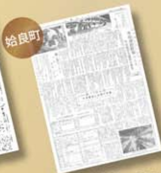
広報あいら第61号 (昭和37年)