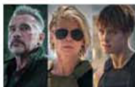
ターミネーター ニュー・フェイト 11/8金

左下の割引券を劇場窓口にお持ちください。1枚4名様まで有効です。保険証など市民を証明するものもあわせてご持参ください。