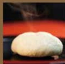
地元・加治木まんじゅう