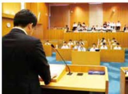
通常の市議会同様、市長、副市長、教育長をはじめ、部長級の職員が答弁する。

今回の議会では、市民を含む学校・保護者など議員関係者のほか、報道陣や市議会議員が傍聴席を埋め、傍聴者から若者議会へのアンケート調査を実施。「若者が社会や議会などに興味を持つ機会になる」「大人顔負けの鋭い意見もあり感動」「インターネット配信など、より多くの子どもたちに見てほしい」との声がありました。市は若者議会で出された質問や提案などを今後のまちづくりに活かしていきます。