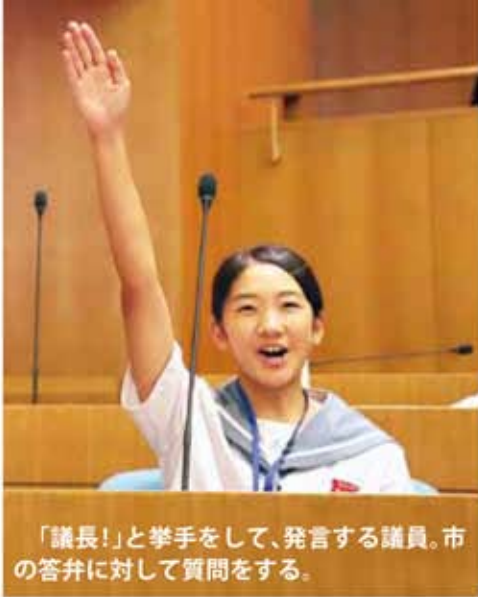
「議長!」と挙手をして、発言する議員。市の答弁に対して質問をする。