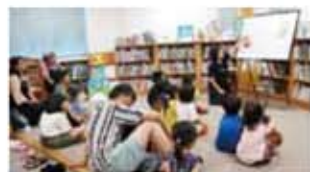
おはなし会の様子

中央図書館 5日・19日(土)午後3時~ 11日(金)午前11時~(おはなしだっこの会)