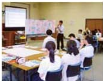
幅広い年代の参加者が意見を交わすワークショップ。