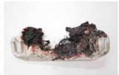
電池が入ったまま出されたおもちゃ。回収後、収集車内で発火。

市の資源物集荷所に出された不燃ごみ(赤袋)を回収した際、ごみ収集車から煙があがる火災が発生。原因は、おもちゃの中に電池が入ったままの状態が出されたためでした。