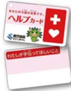
裏に必要とする支援の内容を記載できます。

ヘルプカードとは外見だけではわかりにくい障害や難病、妊娠初期の方などが、周囲の人々に配慮を必要とすることを知らせることで支援を受けやすくなるようにつくられたカードです。県全体で7月1日から配布を開始。市では障害者福祉係と各支所福祉係で配布中です。これまで