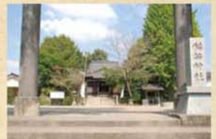
帖佐稲荷神社 代々の薩摩藩主が氏神として崇敬していた

2019年は没後400年。青年期、そして全盛期から晩年までをこの地で過ごした島津義弘公。その義弘公ゆかりの地などをご紹介します。「義弘公の足跡をたどる」編を令和元年度5月号からはじめました。このシリーズは、平成25年から平成28年に本紙で連載した全34回のなかから抜粋してお届けしています。