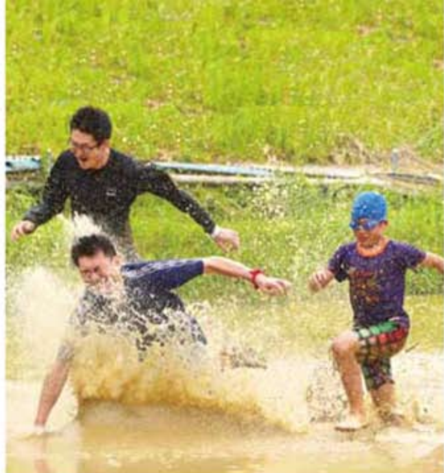
小学校の保護者や消防団で組織される「若衆会」が主催した「どろんピック」。相撲やバレーボールなどを水をはった田んぼで繰り広げる。大人も子どもも関係ない。楽しむことに全員が全力。