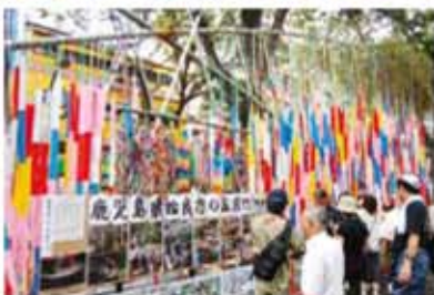
孟宗竹は人通りの多い仙台市民広場横の定禅寺通りに設置。短冊のほかにも1万羽を超える折鶴なども展示され、多くの来場者が早期復興を願う始良市民からのメッセージに足をとめた。