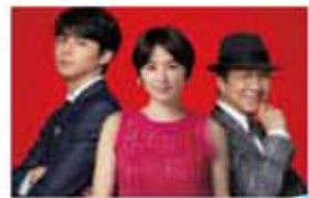
コンフィデンスマンJP 5/17