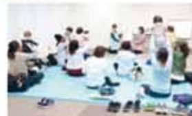
おはなし会の様子

中央図書館 1日・15日(土)午後3時～ 14日(金)午前11時～(おはなしだっこの会)