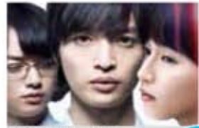
パラレルワールド・ラブストーリー 5/31