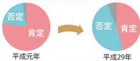
問 男女共同参画係 ☎66-3163