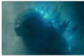
ゴジラ キング・オブ・モンスターズ 5/31