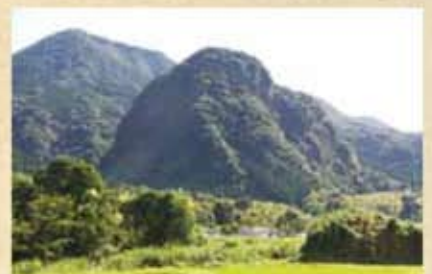
岩剣城遠景(東から)