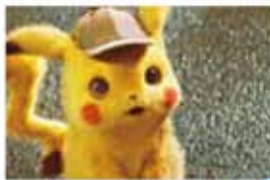
名探偵ピカチュウ 5/3