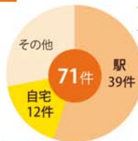
市内自転車盗難数 (H30)