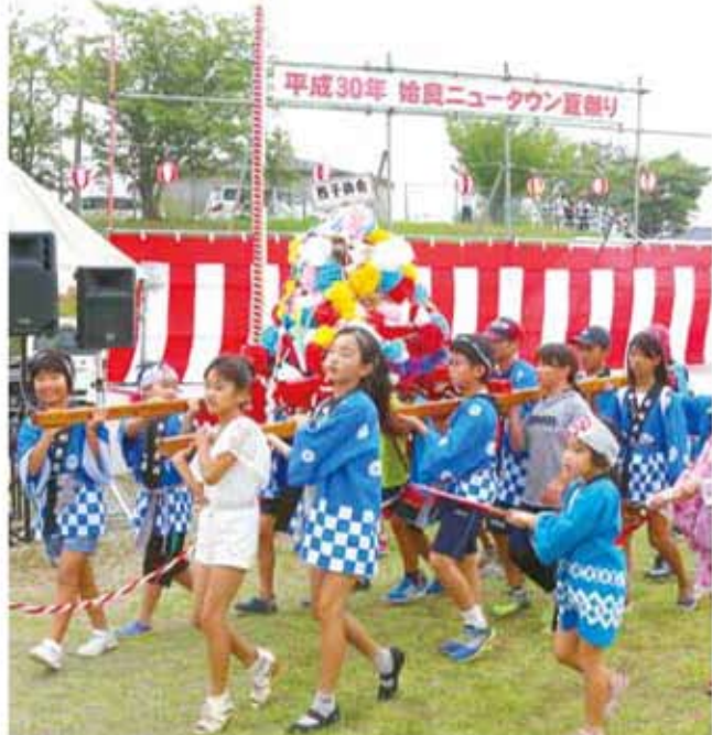
校区内外から多くの来場者が訪れる「始良ニュータウン夏祭り」。西始良校区の伝統行事にしたいとはじまった。神輿を担ぐ子どもたちが地域を練り歩き、開演からステージイベントが続く。