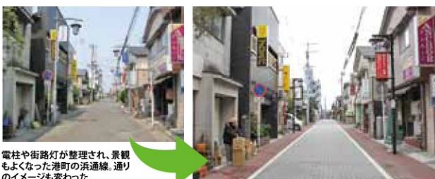
電柱や街路灯が整理され、景観もよくなった港町の浜通線。通りのイメージも変わった。

市の「飲食業サービス重点エリア」として位置づけられている港町。周辺企業の撤退や閉鎖が相次ぎ交流人口も減少しているため、かつての賑わいを取り戻そうと市では今年度、県の補助事業を活用して港町のイメージチェンジを図ることにしました。