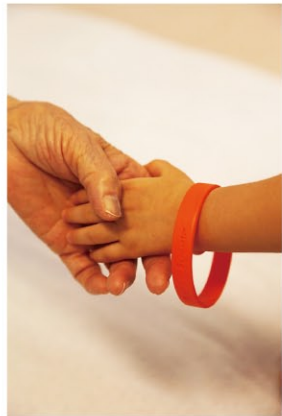
表紙「オレンジリング」

オレンジリングは、認知症を正しく理解し、認知症の人や家族を温かく見守る応援者「認知症サポーター」の証となるブレスレット。始良市には約2400人の認知症サポーターがいます。このオレンジが至る所にあふれるまちを市では目指しています。