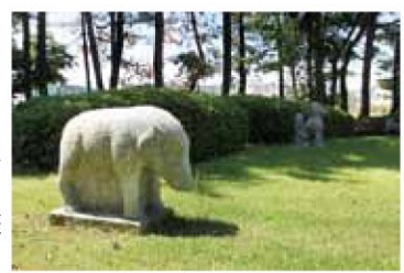
作品の中に登場する動物たちのオブジェが来場者を迎えてくれます。敷地内は、子どもと読書ができる庭園になっています。