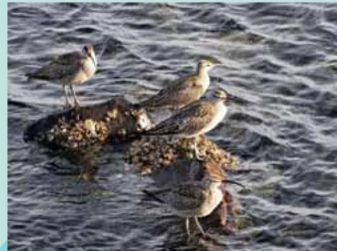
チュウウシヤクシギ

体の色が干潟の色と似ているので、なかなか見つけにくいですが、よく観察していると、くちばしを器用に使い、干潟の穴の中に隠れたカニを引っ張り出して食べる様子を見ることがができる。長旅の途中の、休憩と