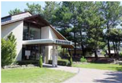
「椋鳩十文学記念館」 Muku Hatoju Literature Museum

開館時間:午前9時~午後5時 休館日:毎週月(祝日の場合は翌日)、年始年末 入館料:小・中学生210円、高校生以上320円 ※学割・団体(15人以上)は団体割などあり。 ※市内の小・中学生は、土・日・祝日、春・夏・冬休み期間中は無料。