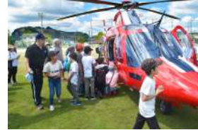
ドクターヘリ・ドクターカー展示 会場：加音ホール・加治木運動場