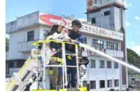
炊き出し訓練・火山版HUG訓練 会場：消防本部 中央消防署