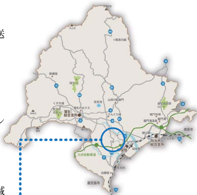
No.11 農村地域防災減災事業 ため池ハザードマップ4か所