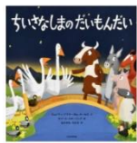
「ちいさなしまの だいもんだい」