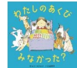
「わたしのあくび みなかった？」