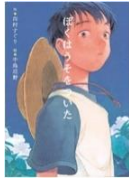
「ぼくはうそをついた」