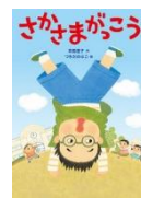
「さかさま がっこう」