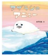
「アザラシのアニュー」