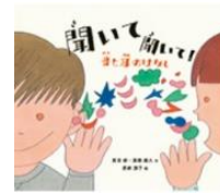
「聞いて聞いて！ 音と耳のはなし」