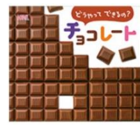
「どうやってできている？ チョコレート」