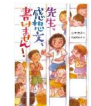
「先生、感想文、 書けません！」