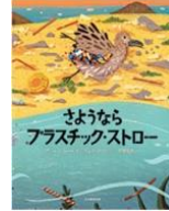
「さようなら プラスチックストロー」