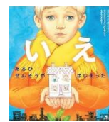
「いえ あるひ せんそうがはじまった」