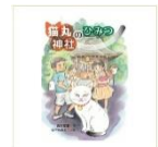
「猫丸神社 のひみつ」