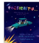
「そのころ 地球では…」