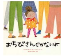
「おちびさんじゃないよ」