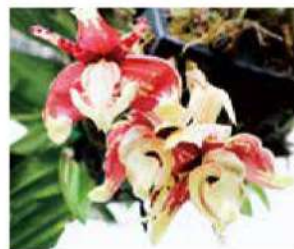
花/スタンホペア・チグリナ 写真/川上 三芳 宅（俄原）

V 日本山川沿いの菜の花、蒲生白男のシバザクラ、思川の紫陽花など市内には季節の花を楽しめる場所がたくさんあります。M・Tさんが教えてくださいましたクチナシも見に行ってきました。本当にいい香りで、またひとつ花の名所が増えました。ありがとうございます。先日、市民の方から「希少なランが咲いた」とご連絡をいただいたので早速、撮影に伺いました。花や手入れの説明を聞きながら、