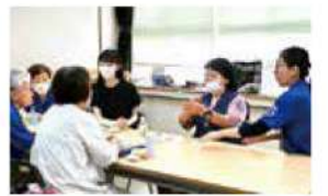
手話で談笑する時間はサークル参加者の大きな楽しみのひとつ。