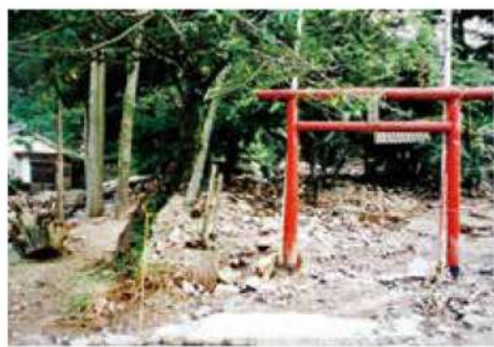
30年前の8月1日、狹霧神社の横を流れる水路を伝うように土石流が発生。社や鳥居は土砂に飲まれてしまった。

あれから30年が経ち、当時の子どもたちは親世代になった。8月豪雨を知らない世代も多くなる中、本号では、また来るかもしれないあの日に備えるため、改めて8月豪雨をふり返る。