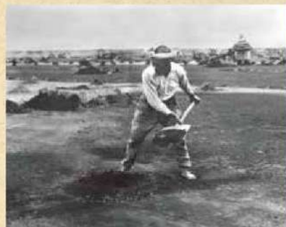
松原塩田での「浜広げ」