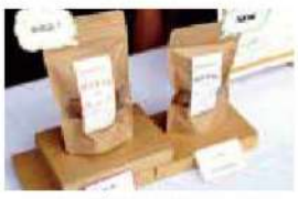
高校生らが商品開発をした、はだか麦のクッキー「ムッギー」。

も素晴らしいですね。 当日は生憎の雨でしたが、みなさん懸命にPRしていただきました。商品の企画だけでなく、価格設定や販売方法まで検討し体験することで、多くのことを学んでいます。こうして高校生のアイデアで地元の食材が活かされる機会があること 高校生らが商品開発をした、はだか麦のクッキー「ムッギー」。