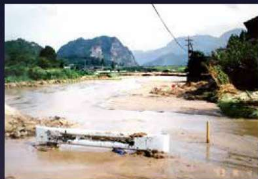
ガードレールの下は水路になっているが、一面が土砂で埋まってどこが水路かわからない。