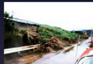
高速道路のり面も数十メートルにわたって崩落。