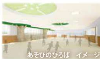
あそびのひろば イメージ