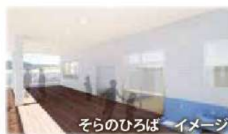
そらのひろば イメージ