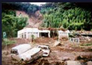
桜島サービスエリアも被災