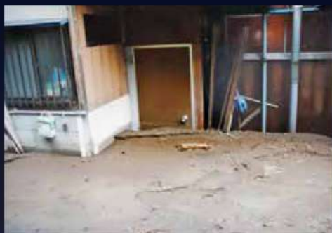
ドアノブの高さあたりまで流れ込んだ土砂。