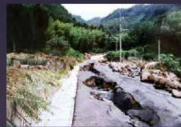
何トンもあるような石がそこら中に転がる。大きな石は路面を割り、流れる水は土を削るため、道路には亀裂のような裂け目ができた。