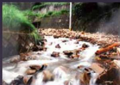
まるで川のような状態の生活道路。