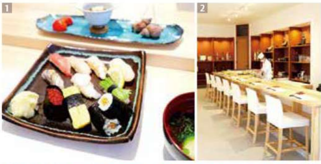
①厳選された10種類のネタの握り寿司に3種類の小鉢と汁物がセットで楽しめる「寿司ランチ(税込3,000円)」②温かみに包まれた和の雰囲気漂う店内ではカウンター席で大将の匠の技を眺めるもよし。1室テーブル席の個室もあり家族でくつろげる。

昨年12月、かもだ通り沿いにオープンした寿司店「かもだ鮎」。長年、和食料理人として腕を磨いた大将が厳選した新鮮な海の幸を使用し、一貫一貫、心を込めて握る。お店でおろす「本わさび」は香りが高く、魚介の風味をグッと引き立てる。昼は完全予約制で、寿司ランチや海鮮丼(税込2,000円・写真右下)を楽しめる。夜は大将が選びぬいた海鮮ネタを存分に味わえるリッチなお任せコース(税込1万円)をご提供。お酒と供に楽しむお客さんも多いという。今月はかもだ鮎さんから食事券1,000円分を5名様にプレゼント。