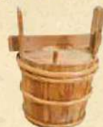
水タンゴ (歴史民俗資料館蔵)