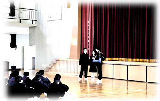
【中学校生活の寸劇に見入る1年生】

1年生に中学校生活を紹介します。生徒会に迎えるために、「入会式」と「部活動紹介」を実施しました。1年ぶりに体育館での実施ができ、部活動の紹介もユニフォームを着用し、工夫を凝らした紹介ができました。堂々とした発表を目の当たりにした1年生は「1日も早く中学校生活に慣れて、先輩のように勉強や部活動に頑張りたい」と意欲を述べました。