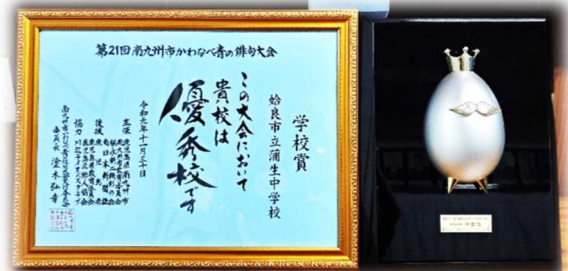
～青の俳句大会「学校賞」表彰状と盾～