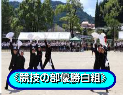
《競技の部優勝白組》

PTA保体部による駐車場整理、PTA種目への積極的な参加、テントの片付けなど協力をいただき、ありがとうございました。