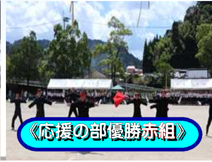
《応援の部優勝赤組》