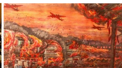
2年 モザイクアート