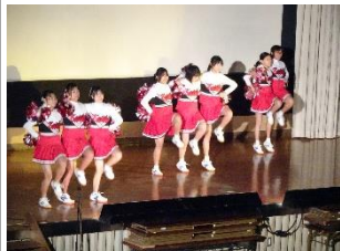
ダンス部舞台発表