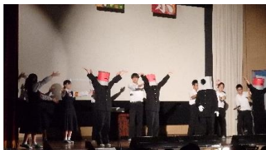
生徒会オープニングセレモニー

11月1日（水）に第43回の文化祭を開催しました。多くの保護者や地域の方が来校していただき，盛大な文化祭となりました。皆様ありがとうございました。