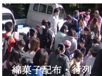
綿菓子配布・行列

観覧者や当事者・馬以外で400名近くのまれにみる賑やかなイベントと成りました。馬も大馬3頭・ポニー2頭それに踊連・園児たちと皆さん方一所懸命演技をして盛り上げてくれました。帖佐校区コミュニティ協議会・ふれあい祭り実行委員会も非常に遣り甲斐を感じ、次への励みと成りました。関係者並びに参加をして頂いた皆様に厚く御礼を申し上げます。幼児などへの綿菓子無料配布や有料ながらゼンザイも大好評で一部資金調達も達成しました。