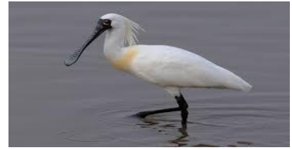
クロツラヘラサギ

特に青雲会病院付近と思川河口付近に、多くの野鳥が生息しているようです。全体を通じては、約50種以上の野鳥を観察することができます。