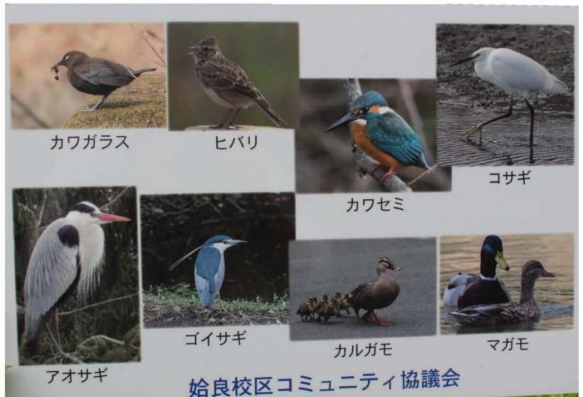
始良校区コミュニティ協議会