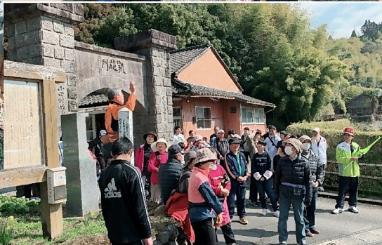
山田のシンボル、凱旋門についての詳しい説明をしていただきました!