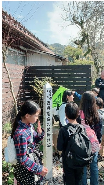
西郷どんが、この石に腰掛け、帖佐人形を鑑賞されたそうです

来年も、もちろん開催します!! どなたでも参加できますので、ぜひお越しください!