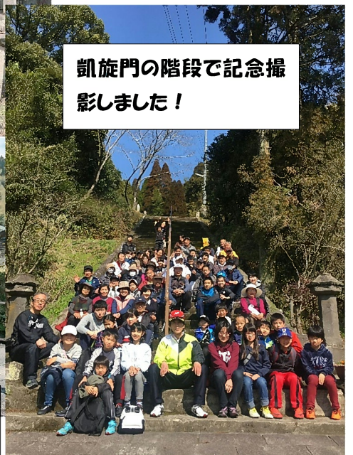
凱旋門の階段で記念撮影しました!