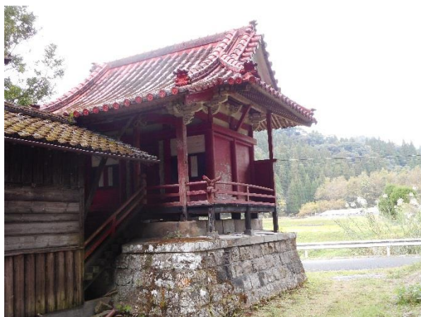
木津志の城野神社