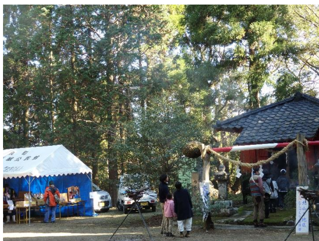
梅北神社 初詣事業