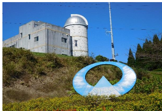
県民の森学習館（学習館）