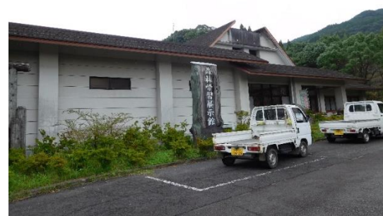
始良生活改善センター