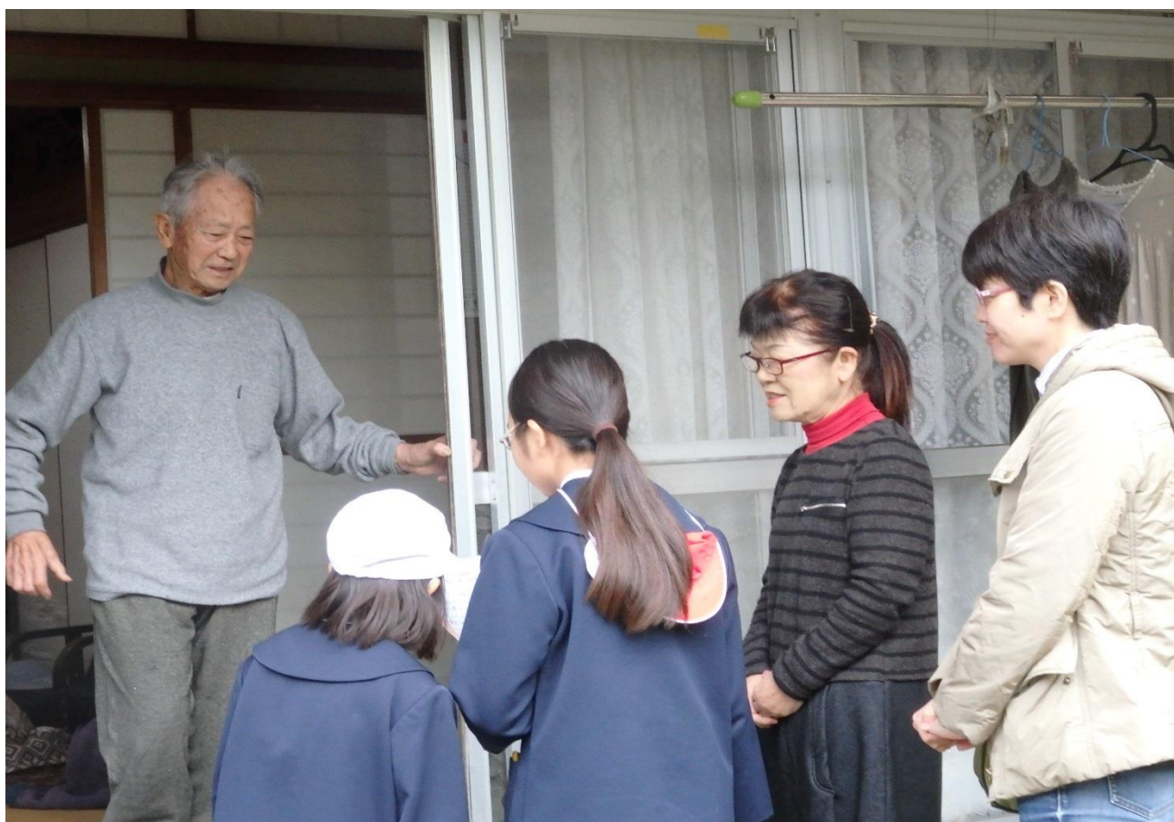
コミュニティ協議会と北山小学校合同の高齢者宅訪問