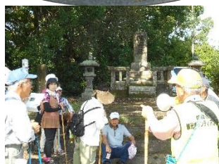
越前重富(島津家)墓所